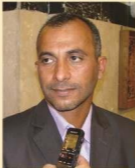
✦ الشاعر خليل الحجاج فيصل