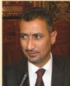
✦ الشاعر شاکر العززي