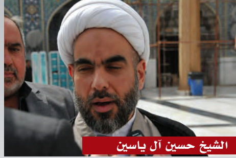
الشيخ حسين آل ياسين