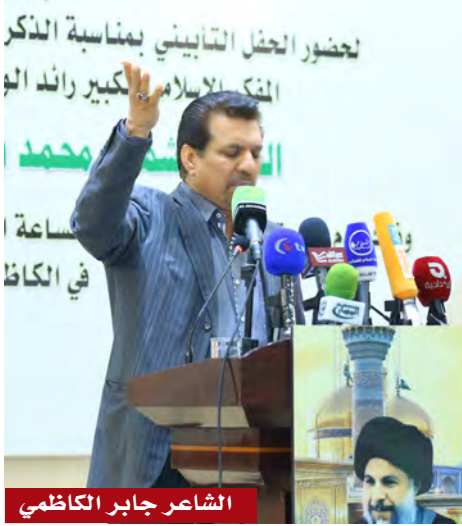
الشاعر جابر الكاظمي