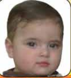
فضل مشرق العمر ١ سنة