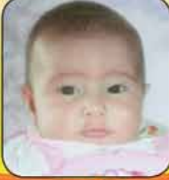
بان زيد العمر ٦ اشهر