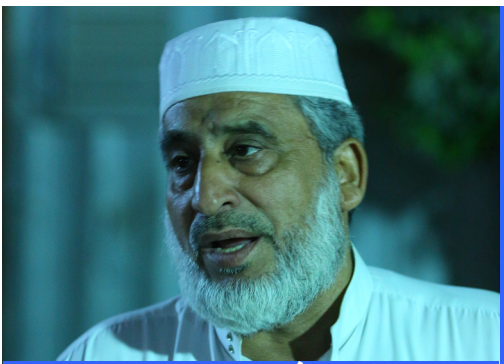
الشيخ فاضل الكتاني