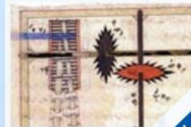
فن الرسم التوضيحي