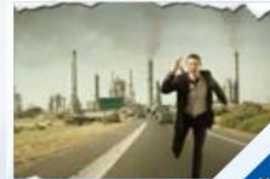
أثر التلوث على الصحة النفسية