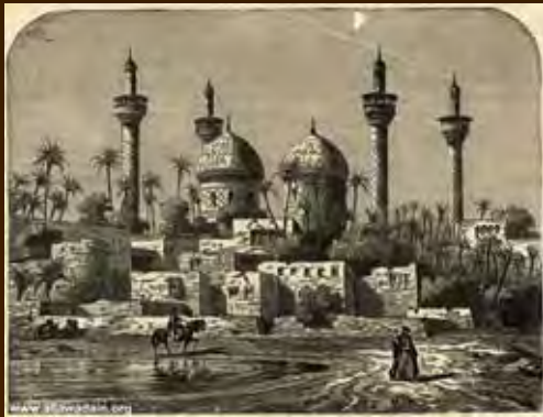
صور قديمة نادرة للمشهد الكاظمي