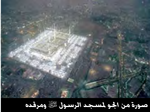
صورة من الجو لمسجد الرسول ﷺ ومرقد

الإمام علي ﷺ تدمع عيناه فقال: يا رسول الله آخيت بين أصحابك ولم تؤاخ بنيي وبين احد. فقال رسول الله ﷺ: أنت أخي في الدنيا والآخرة. وعن جابر بن عبد الله الأنصاري قال: سمعت علي بن أبي طالب ﷺ ينشد ورسول الله ﷺ يسمع: