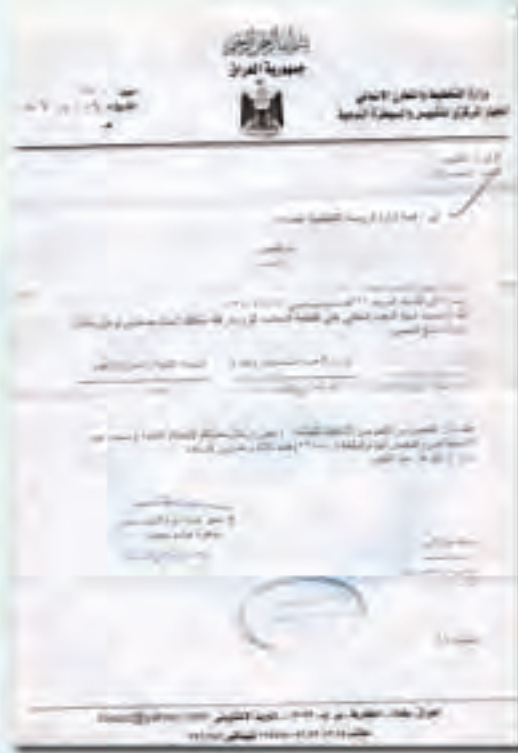
نماذج من تقارير التقييس والسيطرة النوعية