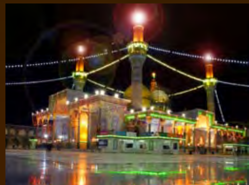
صور حديثة للمشهد الكاظمي