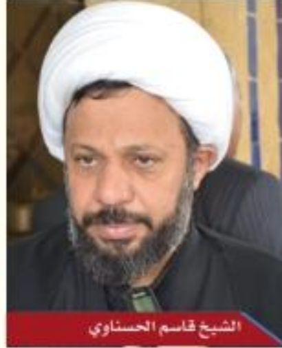
الشيخ قاسم الحسناوي

والإعلاميين ينقلون الصورة الحقيقية لهذا المزار والحاضرون كلهم هم إثنا عشرية وهم محبوبون لزيد عليه السلام ، وأما انتماءه ونسبه الشريف فهو ابن الإمام زين العابدين عليه السلام ، وحضي بحب وشهادة الإمام المعصوم يقول الإمام الصادق عليه السلام : كان عمي زيد عالماً وصدوقاً مضي هو وأصحابه كالشهداء مع أمير المؤمنين عليه السلام ، سماه رسول الله صلى الله عليه وآله قبل ولادة أبيه فكيف ننكره، وكذلك الشاهد