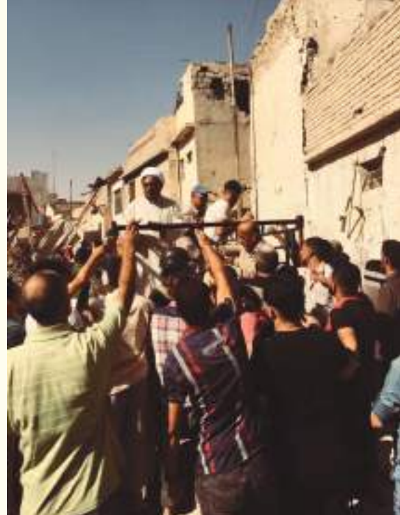
خلال سنوات سيطرة الإرهابيين عليها .