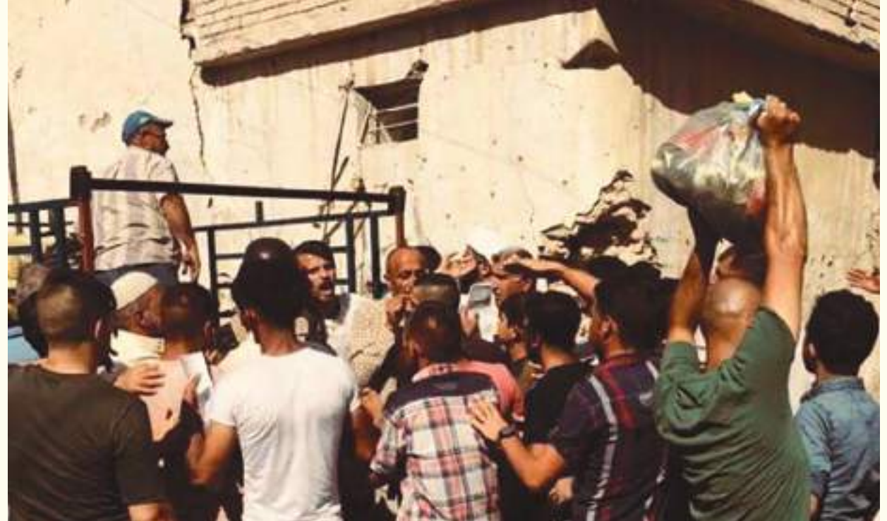
من العتبة الحسينية المقدسة ووزعت على ١٤٥٠ عائلة في مدينة الموصل المنكوبة.

وكانت العتبة الحسينية أنهت في وقت سابق توزيع كسوة العيد على أيتام القوات الأمنية والحشد الشعبي وعوائلهم لمحافظة الفرات الأوسط، سبقتها فعاليات مشابهة في عدد من محافظات جنوب العراق.