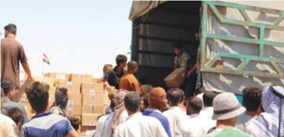
حتى عودة آخر نازح لدياره".

وأضاف: "المساعدات شملت سلات غذائية بلغ عددها (٢٠٠٠) ألفي سلة تحتوي على ثمانية أصناف من المواد الغذائية الرئيسية، إضافة إلى (٢,٥٠٠) قطعة ملابس متنوعة للأطفال، حيث قام كادر اللجنة بتوزيعها على العوائل العائدة التي تعاني من ظروف إنسانية صعبة وبالتنسيق مع لواء (٢١) حشد شعبي".