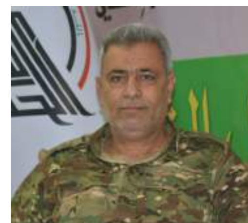
المجاهد السيد علي الحسيني/ الناطق الرسمي لهيئة الحشد الشعبي/ محور الشمال:

بالمعروف أن فرقة العباس القتالية كانت السبب في تحرير مناطق في تحرير مناطق العراق، وقد وهب العديد من أبناء هذه الفرقة الجهادية أنفسهم فداءً لنصرة الدين والوطن وسقط منهم كوكبة من الشهداء في معركة تحرير قرية البشير والمناطق المجاورة لها. تحدث لنا عن ذلك.