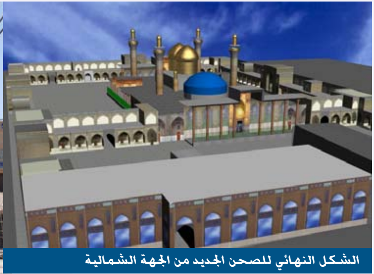
الشكل النهائي للصحن الجديد من الجهة الشمالية