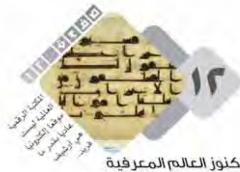
كنوز العالم المعرفية