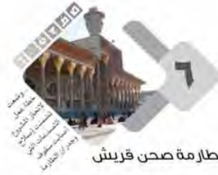
طالبة صحن قريش

ولو أردنا أن نسترسل فإن هذا العمود الذي نفتتح به هذا المنبر عاجز عن أن يلم بهذه الحياة العطرة فبالإضافة إلى الحزن والبكاء والتأوه على ما أصابها فإن استلها سيرتها من قبل الأمة رجالها ونساءها هو مساهمة في تفعيل هذه الذكرى الحزينة في زمن أحوج ما تكون فيه الأمة إلى تنشيط الذاكرة واستلها العبرة قبل العبرة وأنا لله وأنا إليه راجعون.