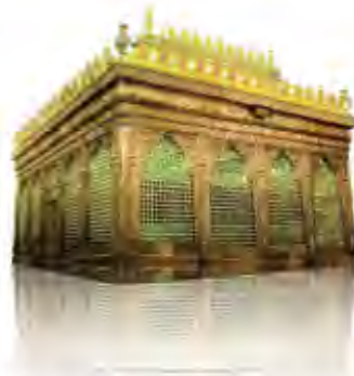
من أبناء الإمام الكاظم عليه السلام

وبالرغم من الأوقات الصعبة، وبسبب شدة التضيق على الإمام عليه السلام فإن أصحابه لم يصرحوا في كثير من الحالات باسمه خوفاً من البطش والتكيل أو القتل. مع هذه الظروف والمضايقات كان الإمام يمارس دوره القيادي والإرشادي للأمة من خلال توجيه أصحابه وأتباعه للتحرك في المجالات العلمية والفكرية، وقد قدم الإمام الجواد عليه السلام هذا الركب المبارك الكبير من تلامذته ورواة حديثه وهم ما بين فقيه وداع للفضيلة والإصلاح ليقوموا بدورهم الفعال والإيجابي للنهوض بواقع الأمة الإسلامية ونشر تعاليم الدين الحق والأمر بالمعروف والنهي عن المنكر والتصدي للاحتراقات الفكرية والسياسية والاجتماعية التي سادت في المجتمع آنذاك نتيجة تخلي السلطة عن المسؤولية والإنشغال بملذات الدنيا.