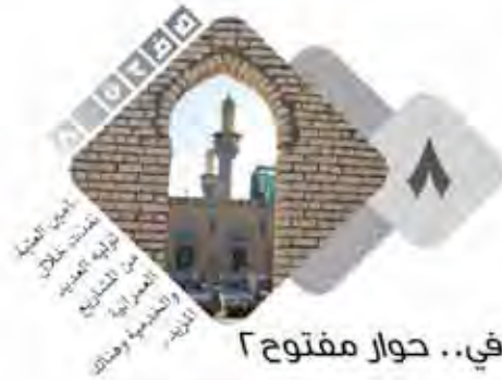
في.. حوار مفتوح ٢