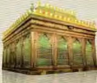
من أبناء الإمام الكاظم عليه السلام