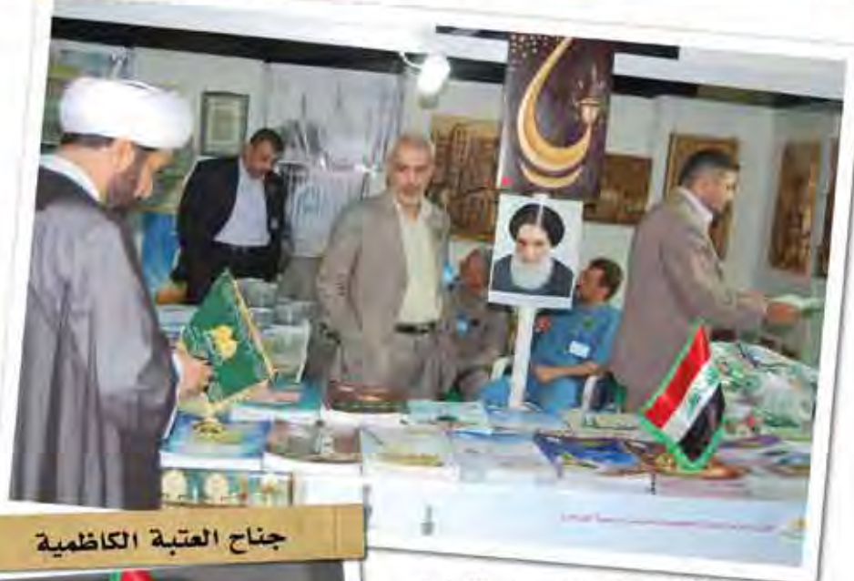
جناح العتبة الكاظمية

يذكر إن هذا المعرض الدولي استمر لمدة (١٠) أيام ابتداءً من ٢٠٠٩/٥/٦، وإن كل الإصدارات