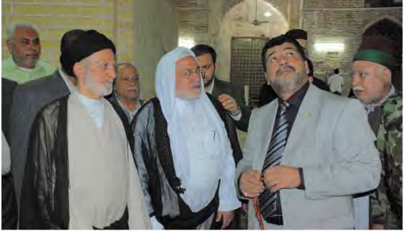
رئيس ديوان الوقف الشيعي لمنبر الجوادين: