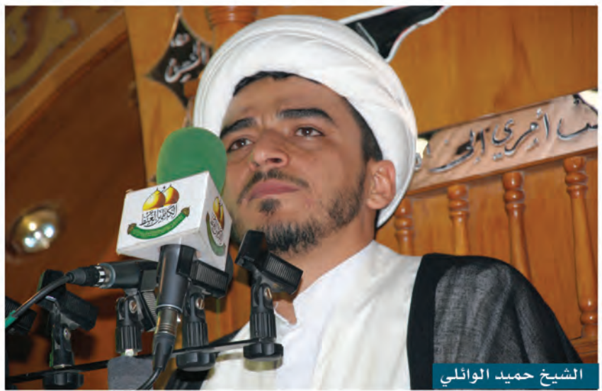
الشيخ حميد الوائلي