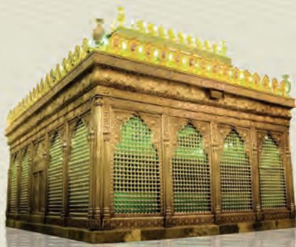
من أبناء الإمام الكاظم عليه السلام

وكان لشهر الله شهر رمضان نصيب واخر فيما خلفه لنا الإمام عليه السلام لتبيان فضل هذا الشهر المبارك وماله من اجر عظيم على من صامه صياماً، كما اراد الله تعالى ورسوله صلى الله عليه واهله وصحبه وسلم صوم الجوارح اي صوم اللسان والعين والاذان واليد والقلب وليس صوم البطون فحسب. فقد روي عن الإمام الجواد عليه السلام انه