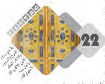
22 الأبواب الذهبية