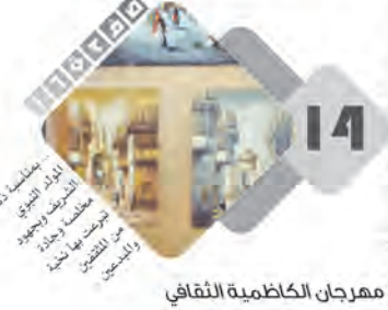
14 مهرجان الكاظمية الثقافية