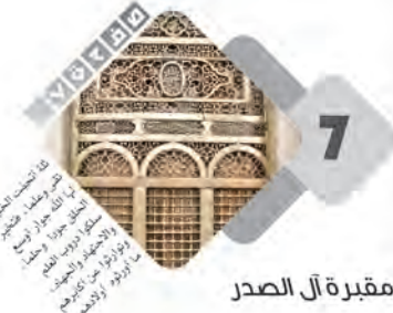
7 مقبرة آل الصدر