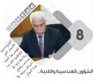
8 الشؤون الهندسية والفنية..