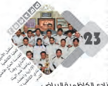
23 نادي الكاظمية الرياضي