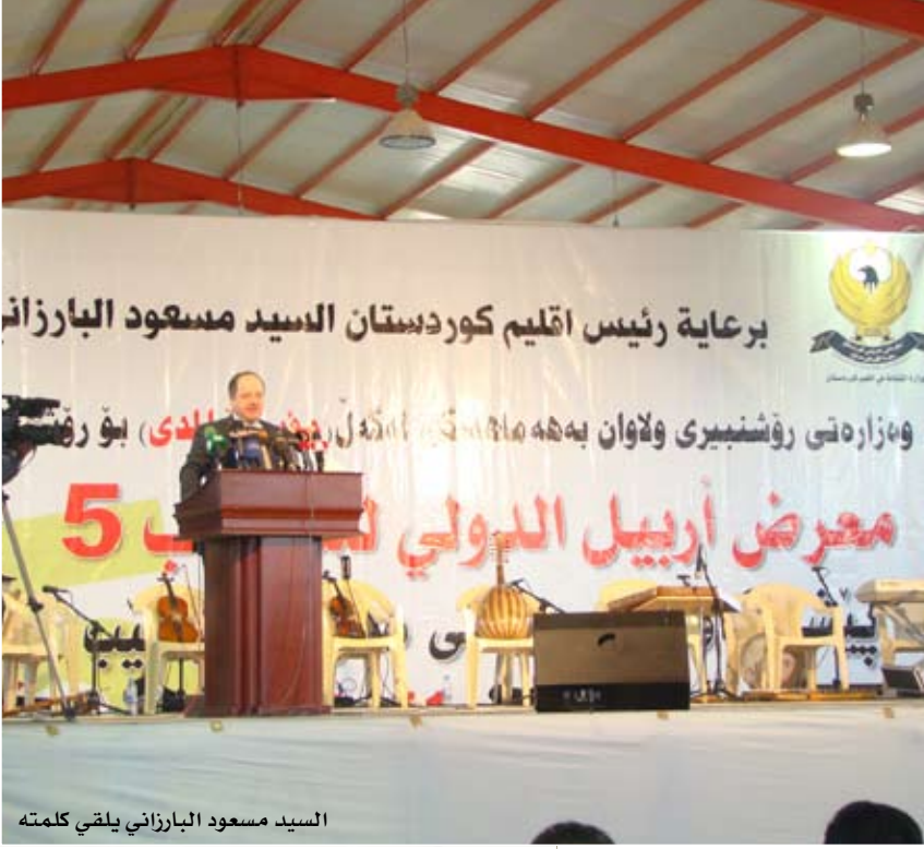
السيد مسعود البارزاني يلقي كلمته