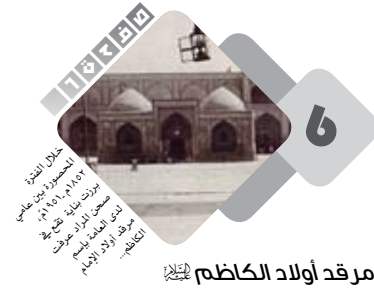
مرقد أولاد الكاظم