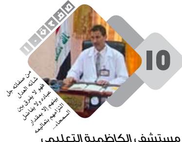
مستشفى الكاظمية التعليمي