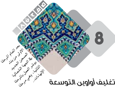
تغليف أوابين التوسعة