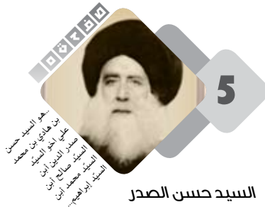
السيد حسن الصدر

فالعبر المستخلصة والدروس الكثيرة في حياة الصديقة لها مدعاة للوقوف طويلاً والتأمل الفاحص لهذا الأنموذج الأنتوي الرائع الذي لم تقعده به مظاهر الأنوثة عن أداء الدور الرسالي والمهمة الإلهية، ثم أن الباحث في معالمها لا بد أن يتخبط أمام أصليين أساسيين هما معناها الذي أثر في التاريخ ولعب دوراً في حياة الناس لأنه كان المثل والقيمة العليا بالنسبة لهم، ومظلمتها التي كانت عنواناً لإقامة الدين وتطبيق الأحكام.