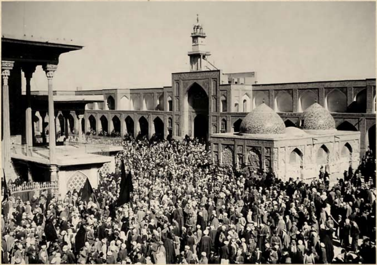
حشود المعزين في عاشوراء يحيطون بالمرقد في الصحن الكاظمي الشريف