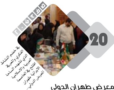
معرض طهران الدولي