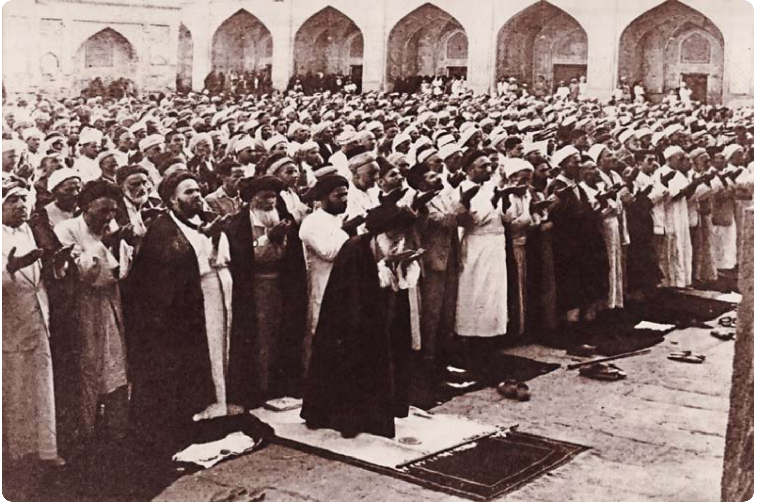
سماحة المرجع الديني الأعلى آية الله العظمى السيد أبو الحسن الأصفهاني رحمته الله يوم المصلين في الصحن الكاظمي الشريف قرب المرقد

حتى يومنا هذا بإمامة سماحة المرجع الديني آية الله الفقيه السيد حسين السيد إسماعيل الصدر رحمته الله ، و يذكر أن من الذين أدوا صلاة الجماعة في هذا الموضع، سماحة المرجع الديني الأعلى، آية الله العظمى السيد أبو الحسن الأصفهاني (قدس) قبيل رحيله إلى جوار ربه عام ١٩٤٦م